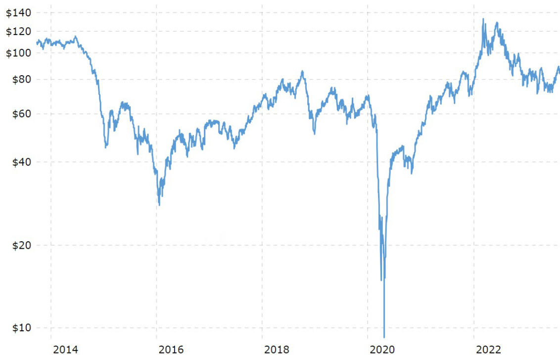
Рис. 3. Колебания цен на нефть марки BRENT

группа руководствуется экономическими соображениями и противостоит политическому давлению, что обуславливает ее авторитет, необходимый для обеспечения стабильности и нормального функционирования нефтяных рынков.