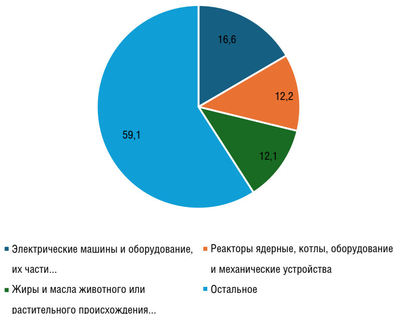
Рисунок 3. Основные категории импорта ЕАЭС из АСЕАН по укрупненным группам, 2023 г., %