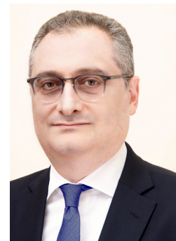
МОРГУЛОВ Игорь Владимирович

Руководством двух стран поставлены амбициозные задачи по дальнейшему наращиванию двустороннего практического сотрудничества, в том числе по обеспечению к 2030 г. существенного, качественного продвижения взаимной торговли и инвестиций. Китай вот уже на протяжении 15 лет является первым торговым партнером России, а наша страна занимает пятое место в списке его внешнеторговых контрагентов. В 2024 г. двусторонний товарооборот побил очередной рекорд, составив без малого 245 млрд долл. В последние годы предпринимаются планомерные скоординированные усилия по переводу межгосударственных расчетов в национальные валюты, активно развивается инвестиционное сотрудничество, осуществляются или готовятся к реализации свыше 80 приоритетных российско-китайских проектов на сумму порядка 200 млрд долл. в таких областях, как промышленное производство, транспорт, логистика, сельское хозяйство, добыча полезных ископаемых. Рассчитываем, что дальнейшему росту совокупного объема встречных